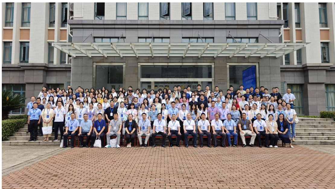
图 5 承办 2025 年黄石市中等职业学校教学能力大赛与班主任能力 比赛

与此同时，21 名班主任教师参加班主任能力比赛。他们围绕学生思想政治工作、组织班级活动、班级管理、职业指导、沟通协调等核心内容，通过笔试、现场班级活动策划、现场展示和现场答辩四个环节，展现了我市职业学校班主任的育人智慧与管理艺术。