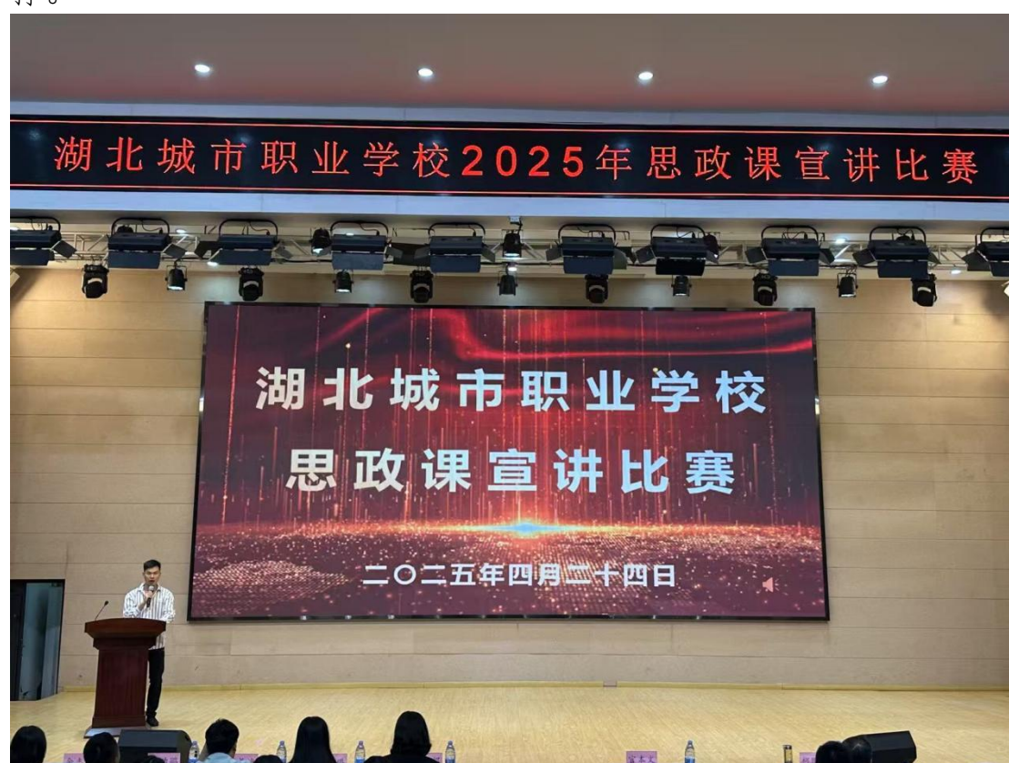
图 17 湖北城市职业学校 2025 年思政课宣讲比赛

此次比赛是学校深化思政课建设的重要实践。活动紧密围绕立德树人根本任务，引导教师深刻理解并生动阐释习近平新时代中国特色社会主义思想。通过以赛促教、以情促学，不仅锻炼了教师的宣讲能力，更显著增强了思政课的思想性、针对性与吸引力，推动了课程建设质量整体提升，为培养担当民族复兴大任的时代新人提供了有效支撑。