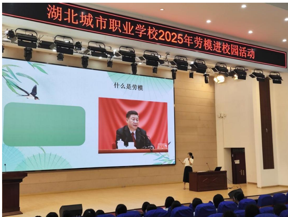
图 11 湖北城市职业学校 2025 年劳模进校园活动