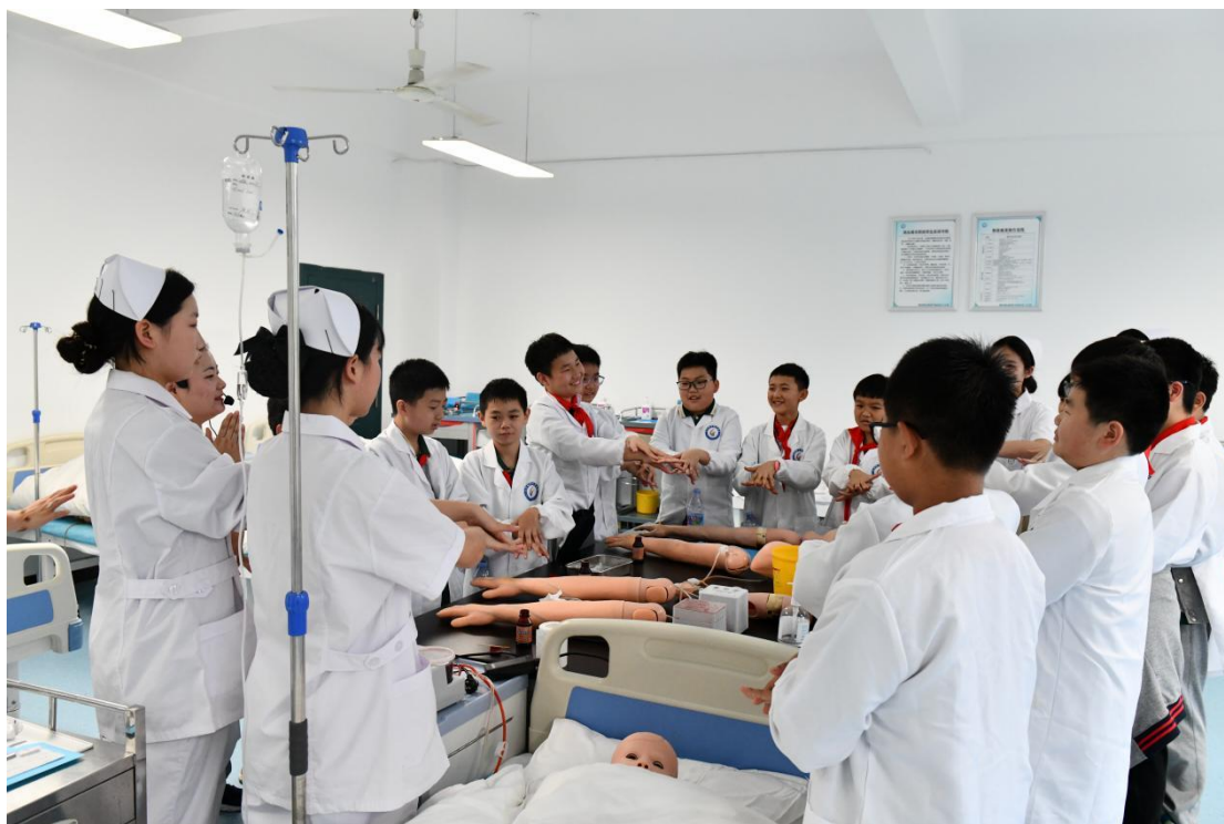
图8 中小學生職業體驗活動-護理急救師體驗現場