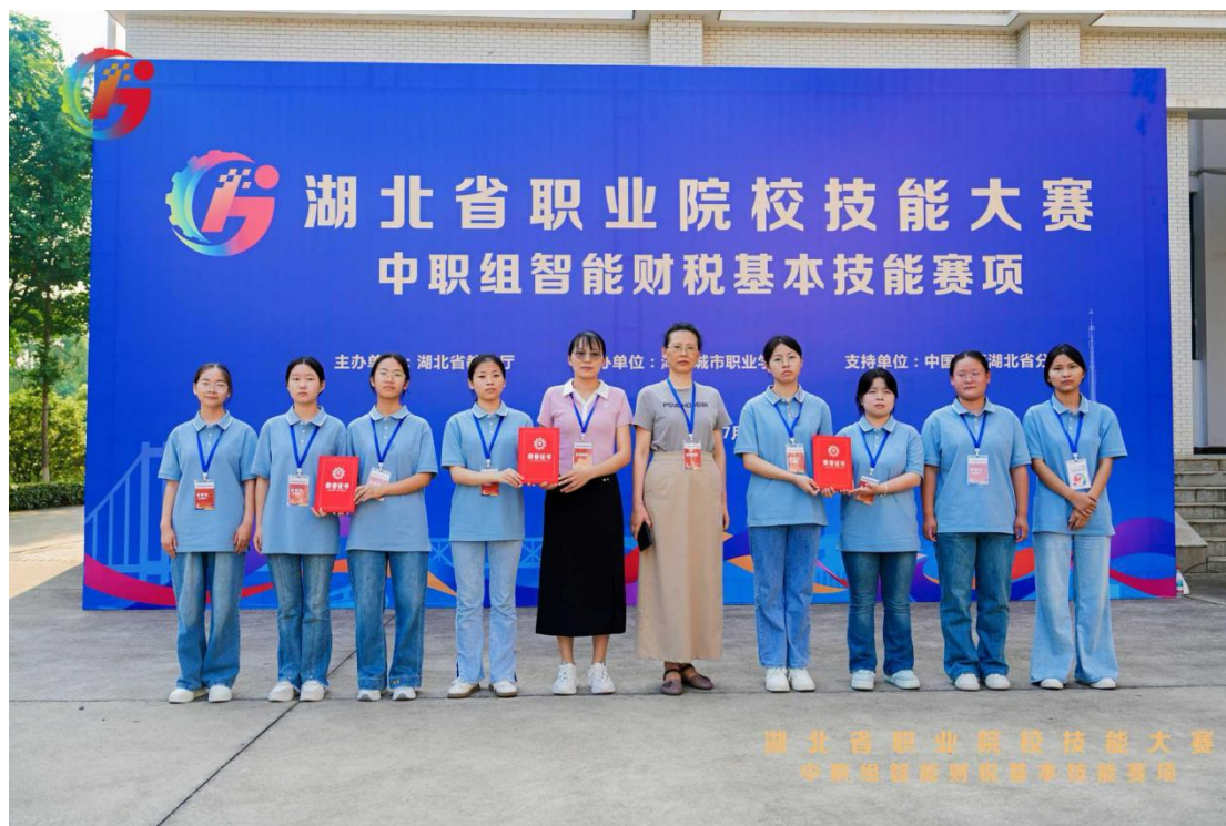
图6 承办湖北省职业院校技能大赛中职组智能财税基本技能赛项

未来，我校将继续发挥自身优势，积极承办各类高水平赛事，搭建交流展示平台，推动职业教育高质量发展，为服务地方经济和社会发展贡献更多“城职力量”。