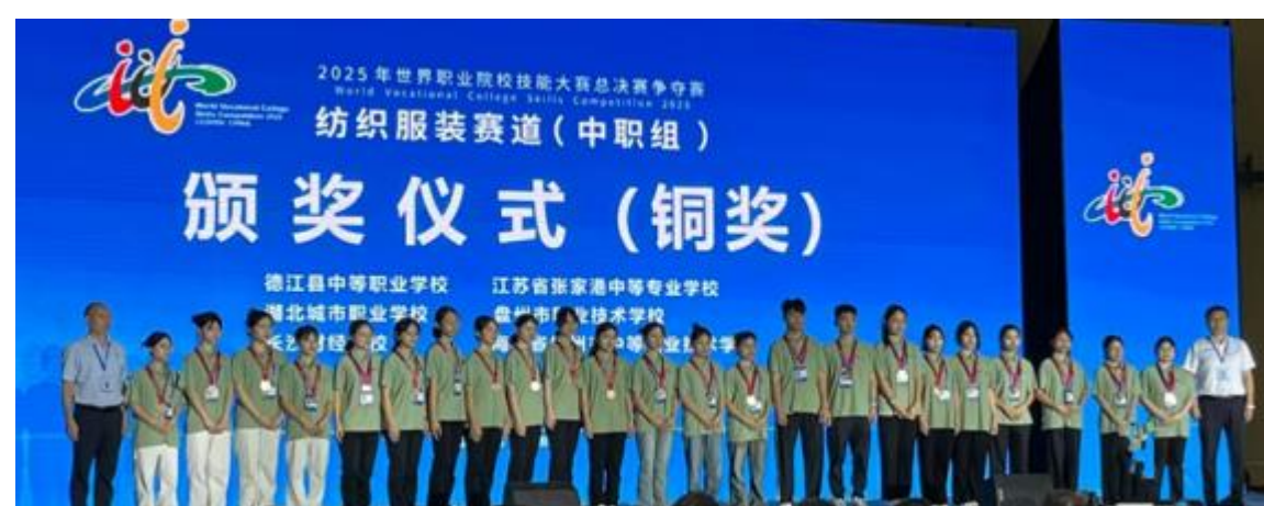
图 16 湖北城市职业学校在 2025 年世界职业院校技能大赛总决赛争夺

学校将以此为契机，持续完善“以赛促教、以赛促学、以赛促改”机制，加强技术技能锤炼与团队协作，为职业院校提升育人质量、服务区域发展提供可复制的典型经验。