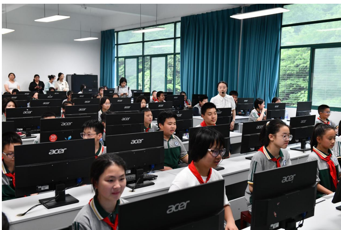
图9 中小學生職業體驗活動-小小出納員體驗現場

此次活動搭建了職業教育與基礎教育融合發展的平臺，推動社會形成“崇尚技能”的良好氛圍。學校將持續創新職教體驗形式，助