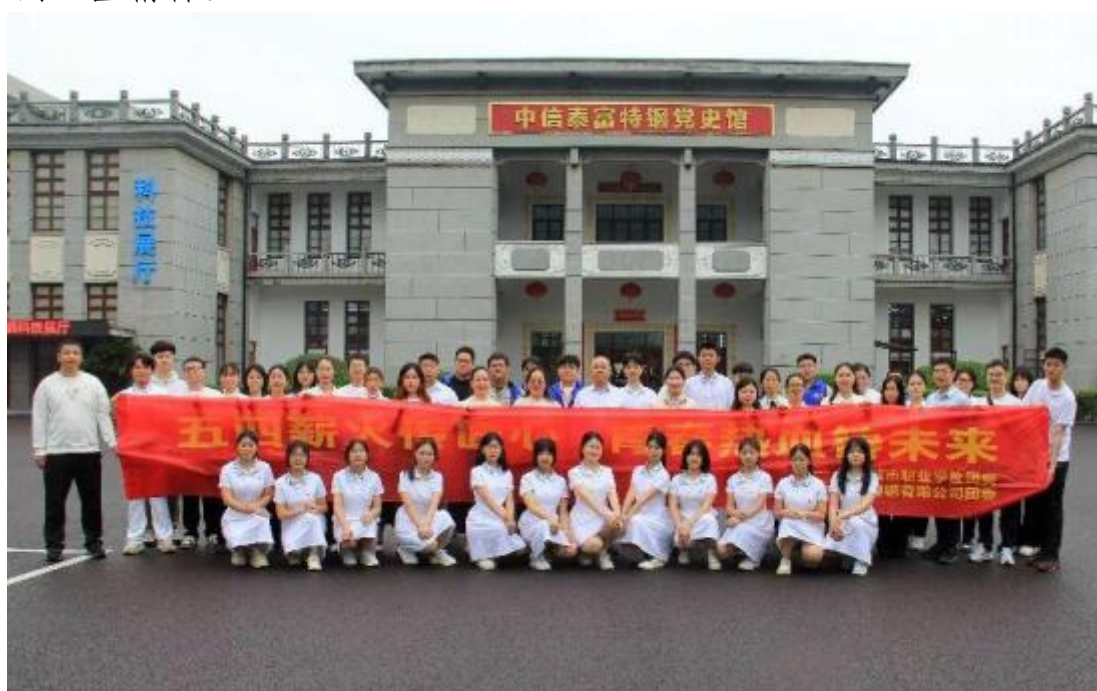
图 3 学校与大冶特钢公司联合开展了“五四薪火传匠心 青春热血铸未来”主题团日活动

此次团日活动不仅是一次爱国主义教育，更是一次生动的实践课堂。通过实地参观和学习交流，青年师生深受鼓舞，表示要将“五四”精神与工匠精神融入日常工作和学习中，为学校发展和社会进步贡献青春力量。