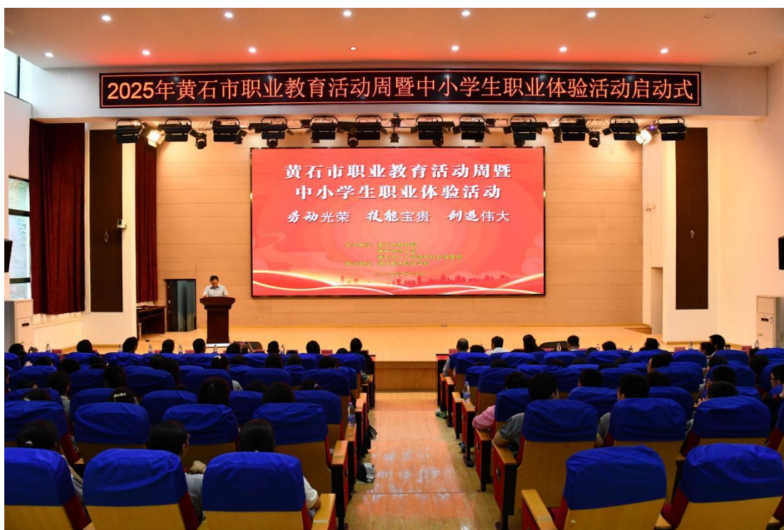
图 7 承办 2025 年黄石市职业教育活动周暨中小学生职业体验活动

医药卫生部实训室内，小学生化身“护理急救师”，在专业教师示范指导下，开展心肺复苏、伤口包扎等急救。通过沉浸式实操，增加了急救知识，增强了对生命的敬畏。经贸服务部的“小小出纳员”体验现场，同学们通过点钞训练、账目核对等实践，理解数学知识在职业场景中的应用。