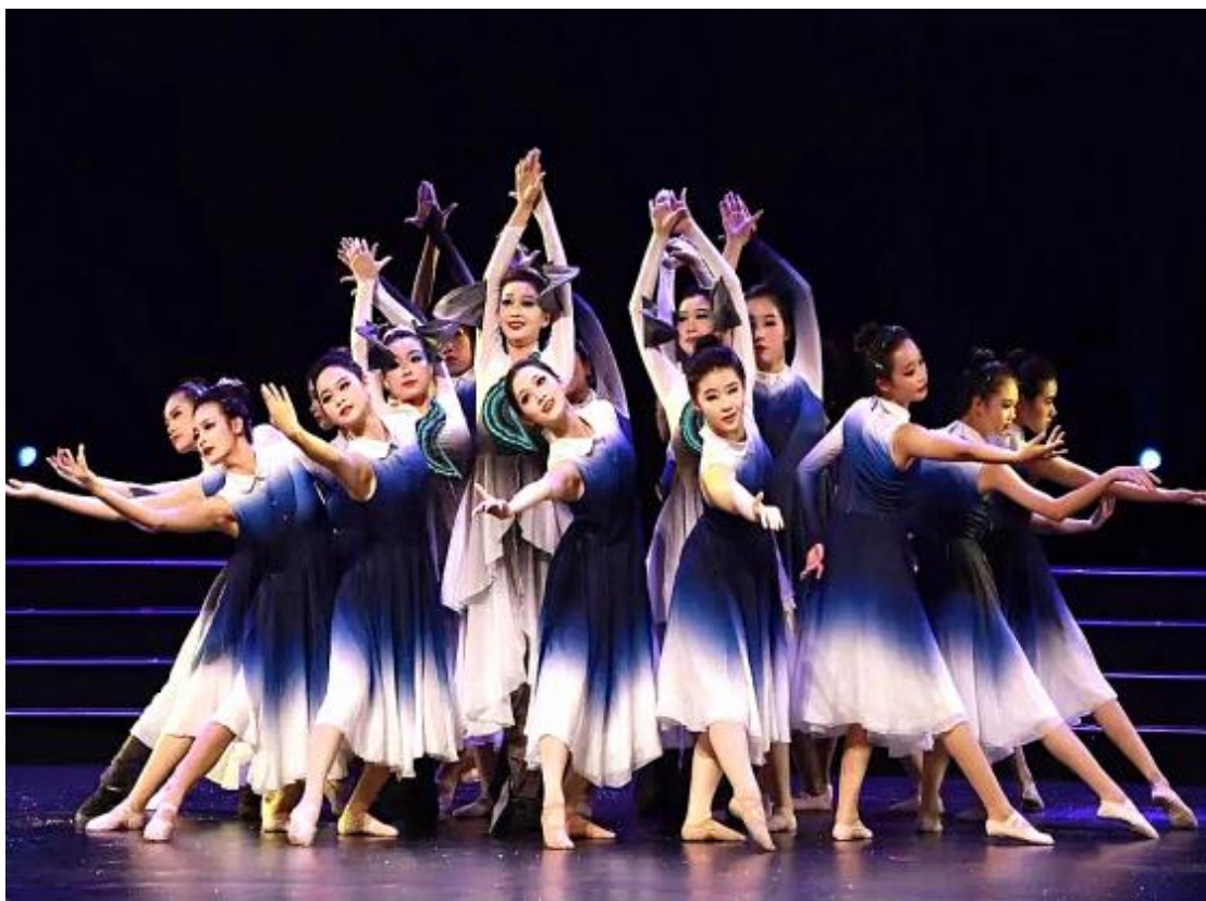
图 4 湖北省第十三届黄鹤美育节评选结果揭晓，我校舞蹈《逐豚江上立》获一等奖