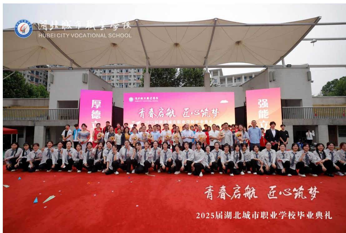
图 2 学校 2025 届毕业典礼合照

最后，典礼在“青春启航”篇章的歌舞中落下帷幕，2025 届毕业生带着母校的嘱托与祝福，正式踏上“青春启航，匠心筑梦”的新征程，在未来的道路上勇毅前行，书写属于自己的精彩人生。